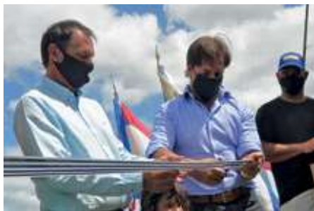
• Inauguración Cosecha de Arroz 2021