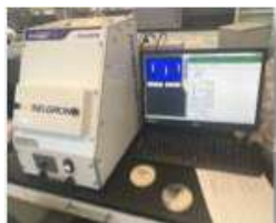
▲ Analizador de imágenes, Selgron