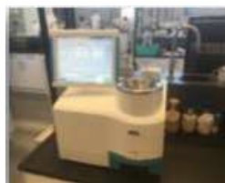
▲ Medidor de composición por infrarrojo (NIR), Perten