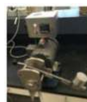
▲ Pulidora de arroz, McGill