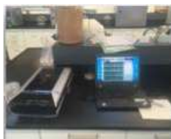
▲ Scanner con software de análisis de imágenes, Satake