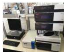
▲ HPLC, Tecnofrom