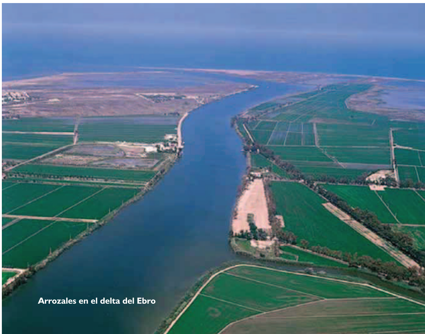
Arrozales en el delta del Ebro

suministros que poseen los grandes países exportadores, impulsará en 2014 el comercio mundial de arroz en un 7 por ciento a un volumen sin precedentes de 39,7 millones de toneladas. Se prevé que las importaciones aumentarán