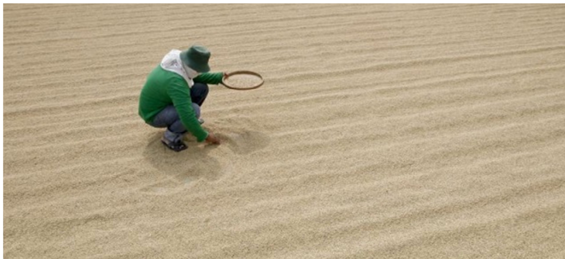
Agricultor tailandés seleccionando arroz

El Gobierno gastó 27.000 millones de dólares desde 2011 en subsidios para arroz