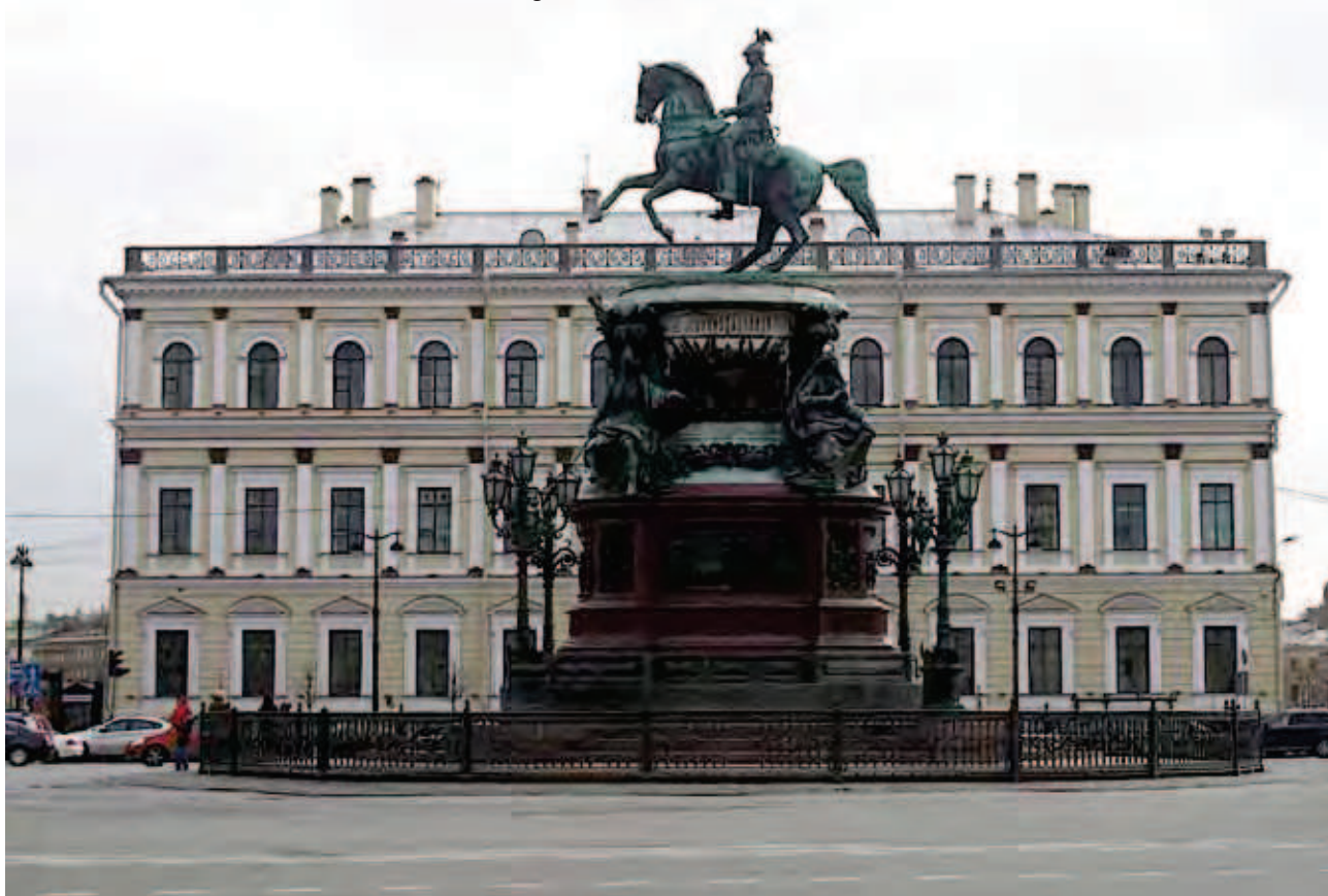
Sede del Instituto Vavilov de San Petersburgo

Además mantuvieron una entrevista privada con el Gobernador de la Ciudad, siendo considerada muy importante ya que es un cargo calificado muy jerárquico dentro del Gobierno Ruso.