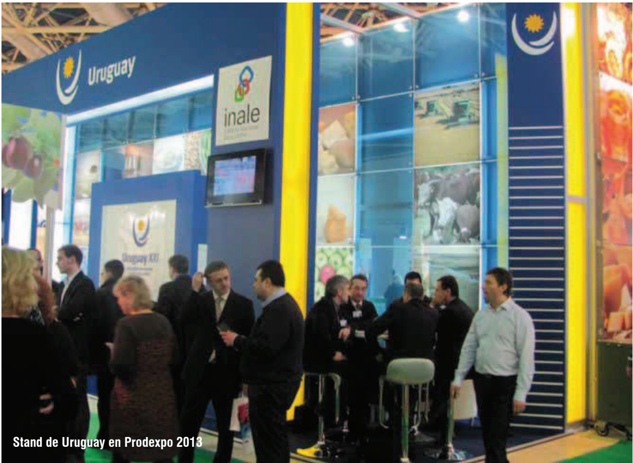
Stand de Uruguay en Prodexpo 2013

calidad, homogeneidad e inocuidad del producto.