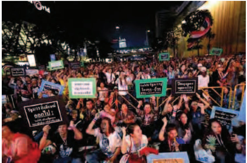
Protestas populares en Tailandia por la crisis económica

Guerra de precios es un término utilizado en los negocios para definir un estado de intensa competitividad acompañada con una serie de reducciones de precios multilaterales. Un competidor bajará su precio y otros lo harán en mayor cuantía. Si uno de los que han reaccionado reduce su precio por debajo del primero, entonces se inicia una nueva ronda de descensos. A corto plazo, las guerras de precios son buenas para los consumidores que pueden beneficiarse de los precios bajos pero la contracara es que esta baja desenfrenada puede hacer perder toda ganancia, por lo que se terminan generando efectos negativos. De todas formas en este contexto juegan otros elementos adicionales a los precios como ser la rea-