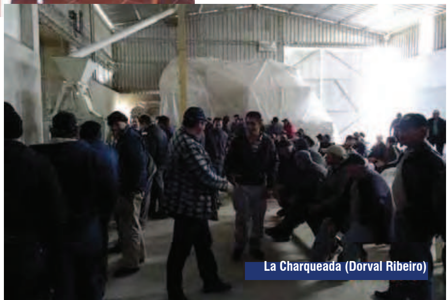
La Charqueada (Dorval Ribeiro)

De acuerdo a los comentarios recibidos de los presentes en dichas reuniones, la actividad fue muy provechosa en la que destacaron la claridad y amabilidad con que se hicieron las presentaciones, por parte de los Tec. Prev. del Banco.