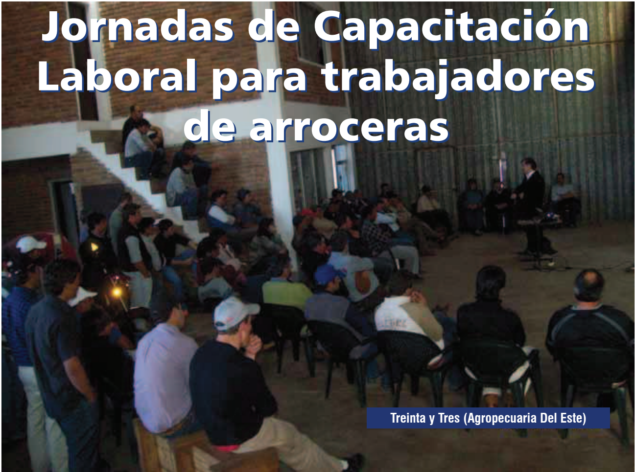
Treinta y Tres (Agropecuaria Del Este)

Desde que comenzó en el año 2010 esta actividad de ACA a nivel de todas sus Regionales, siempre ha recibido una gran aceptación por parte de sus asociados y de los trabajadores.