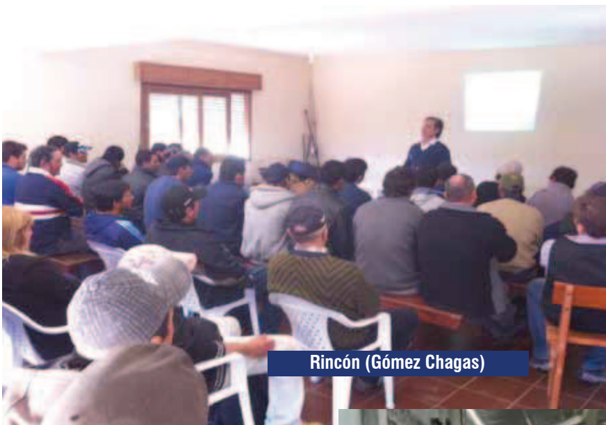
Rincón (Gómez Chagas)

O sea el patrón debe poner al alcance todos los elementos de protección personal para los trabajadores, lo que debe ser consignado en un documento que debe firmar el trabajador. Y por otro lado este está obligado a usarlos como está establecido en las normas