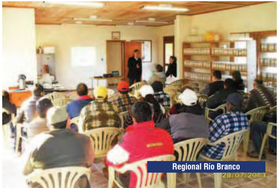
Regional Río Branco

La concurrencia de trabajadores a dichas jornadas fue muy numerosa, en las que se hicieron presentes cerca de 300 trabajadores y donde el número fue especialmente alto en las de la tradicional zona arrocerá de la Cuenca de la Laguna Merín, destacándose las realizadas en las de Rincón, Treinta y Tres, La Charqueada y Cebollatí. Fundamentalmente en estas jornadas se trabajó sobre los derechos y deberes de los trabajadores, haciendo especial