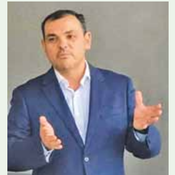
Por Leonardo Bolla Director de Agromedios

A pesar de la pandemia global las primeras señales que surgen sobre las perspectivas para el complejo arrocerero en los mercados externos son positivas, ya que de las mismas depende la mayor parte de la producción nacional y apuntan a definir un escenario que impulsa los precios internacionales con vistas a una demanda sostenida.