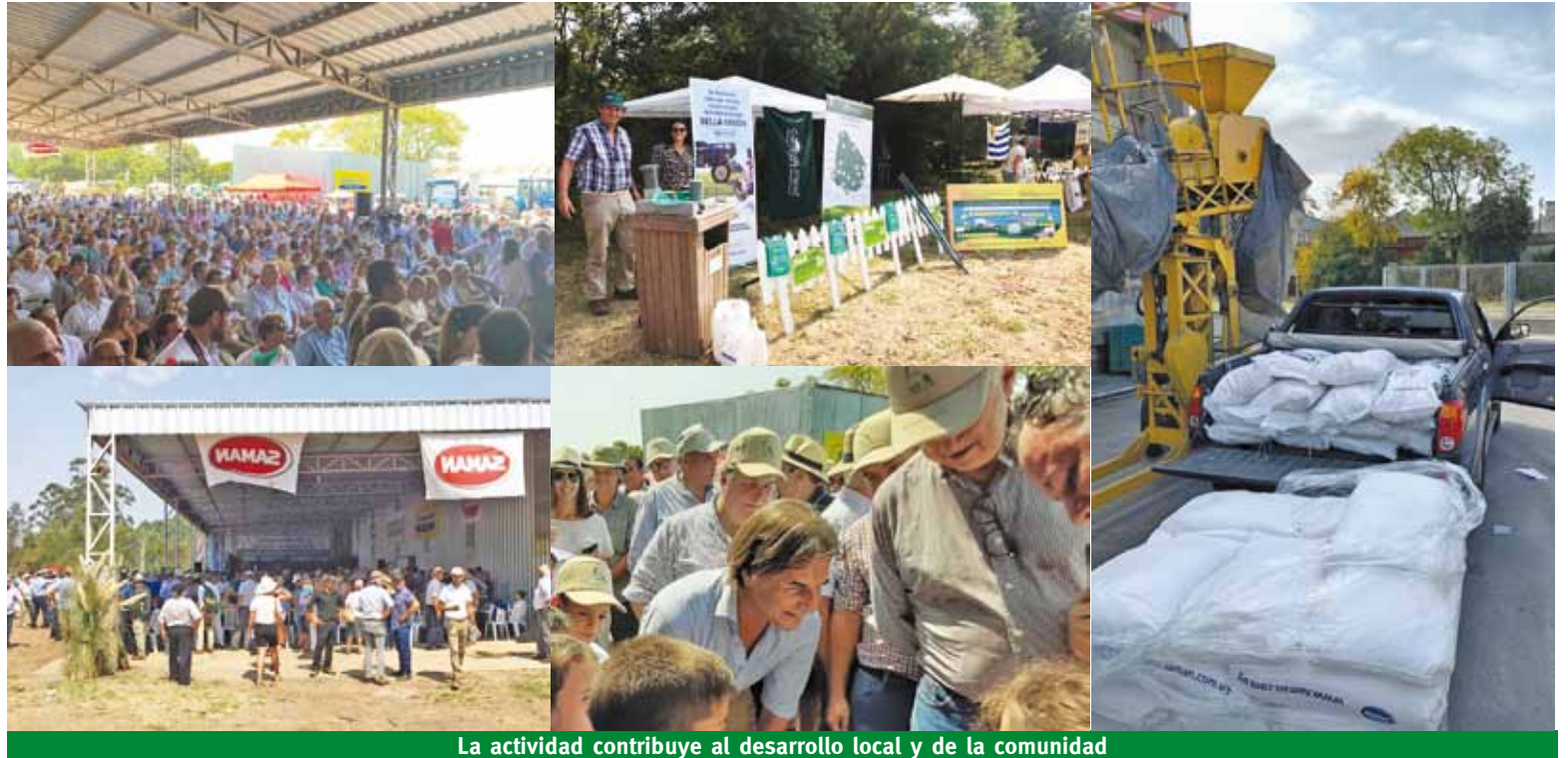
La actividad contribuye al desarrollo local y de la comunidad

De esta forma, el rubro contribuye con su aporte al desarrollo comunitario en las diferentes localidades e impacta en la generación de empleos directos e indirectos en los diferentes centros poblados y zonas rurales del país.