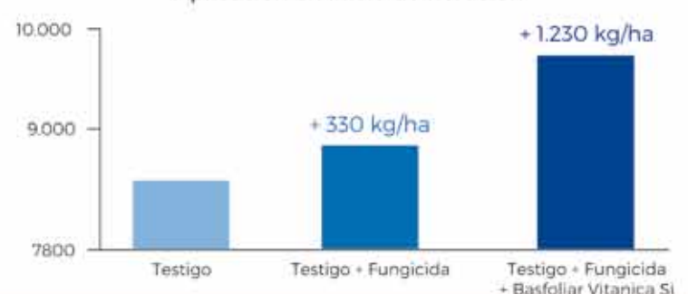
Asinagro, 2019-20. La Charquedra, Treinta y Tres Aplicación en inicio de floración