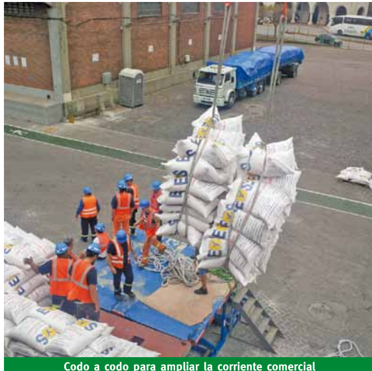
Codo a codo para ampliar la corriente comercial

La detección en una trampa de un contenedor de dicha plaga prohibida por los servicios técnicos y sanitarios aztecas, llevó a las autoridades de los ministerios de Ganadería y de Relaciones Exteriores y la industria arrocera a promover las gestiones para la reapertura de