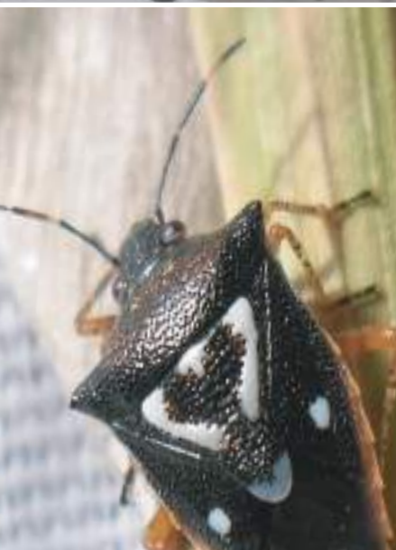
MORMIDEA SP. (ADULTO)