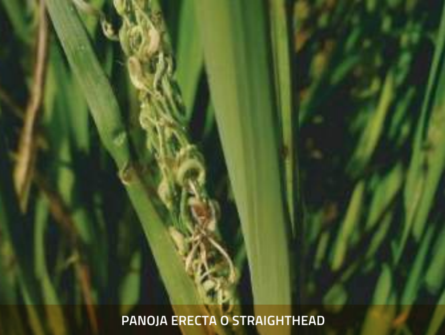
PANOJA ERECTA O STRAIGHTHEAD