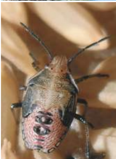
MORMIDEA SP. (NINFA)