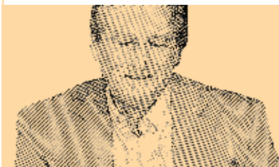
La Coronilla, Rocha 39 años años de cultivador