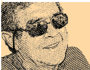
Treinta y Tres 41 años de cultivador