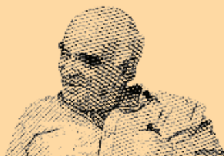
Costas del Parao (Rincón de Ramírez), Treinta y Tres. 30 años de cultivador