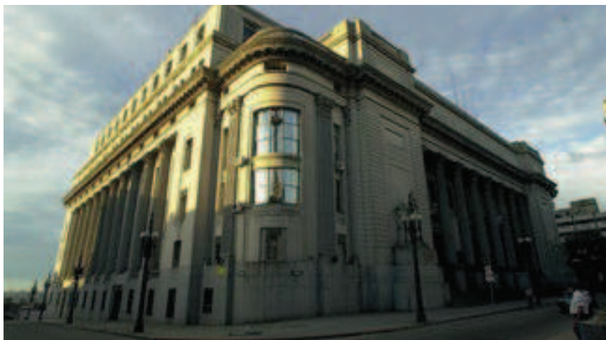
◀ Sede central del BROU (Ciudad Vieja)

de las exportaciones de arroz por un período de cuatro o cinco años. A la fecha queda pendiente algo más de USD 22.000.000 (veintidós millones de dólares).