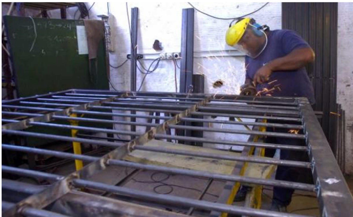
Menor actividad industrial puede ocasionar pérdida de empleos.

Como en un cóctel, diferentes factores se entremezclan y llevan a una desaceleración en la actividad industrial y comercial. Una compleja relación con los socios del Mercosur, poca rentabilidad, caída de precio de los commodities, pérdida de competitividad, altos costos operativos, tipo de cambio, reclamos salariales y la sequía son los mayores aspectos negativos señalados por la industria, el agro y el comercio.